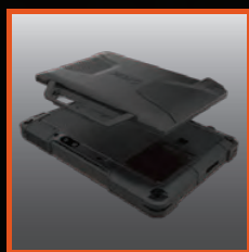
Componente aggiuntivo SnapBack